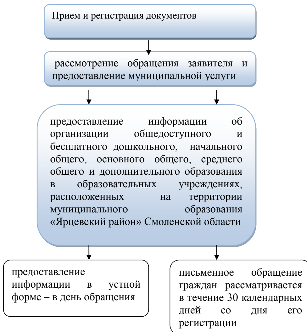
Схема последовательности действий получателей муниципальной услуги «Предоставление информации об организации общедоступного и бесплатного дошкольного, начального общего, основного общего, среднего общего и дополнительного образования в образовательных учреждениях, расположенных на территории муниципального образования «Ярцевский район» Смоленской области»

Приложение № 2 к Административному регламенту Администрации муниципального образования «Ярцевский район» Смоленской области, утвержденному постановлением Администрации муниципального образования «Ярцевский район» Смоленской области от « ____ » _____ 2013 г.